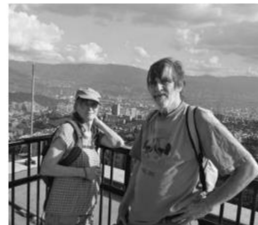
FILM OM BOBYGDA?